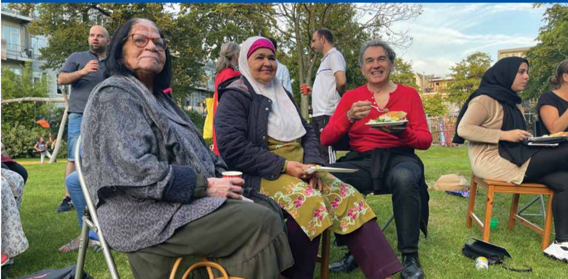
En dan ... lekker eten en ontspannen met alle vrijwilligers van Huize Middelland