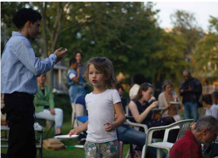
Op het Dierenlandje