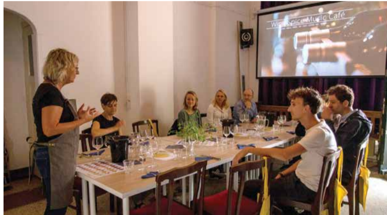
Leer van alles over sap | wijn | spijs bij de proeverij in de Graaf Floris