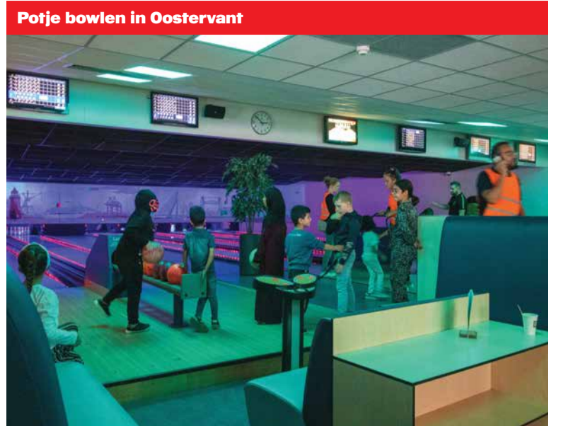
Potje bowlen in Oostervant