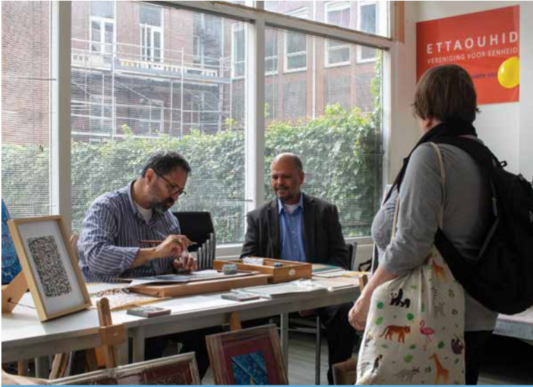
Leren kalligraferen bij Ettaouhid