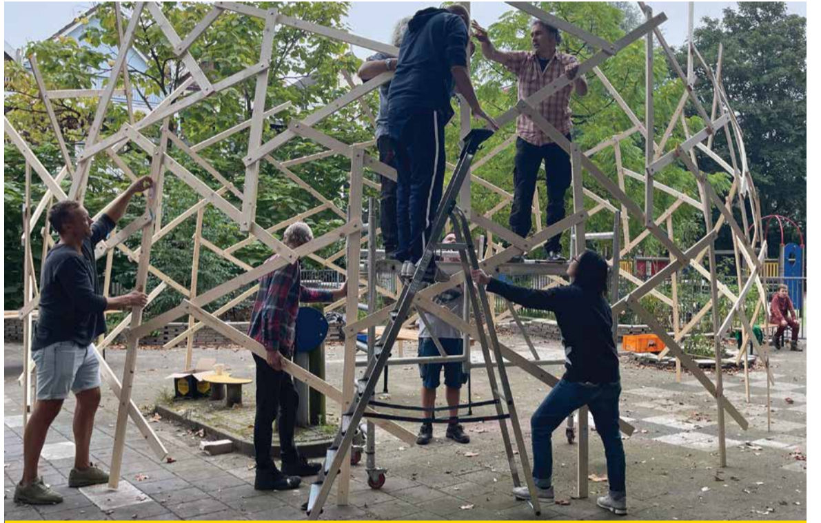
Bouwen aan de Da Vinci koepel bij het Wijkpaleis