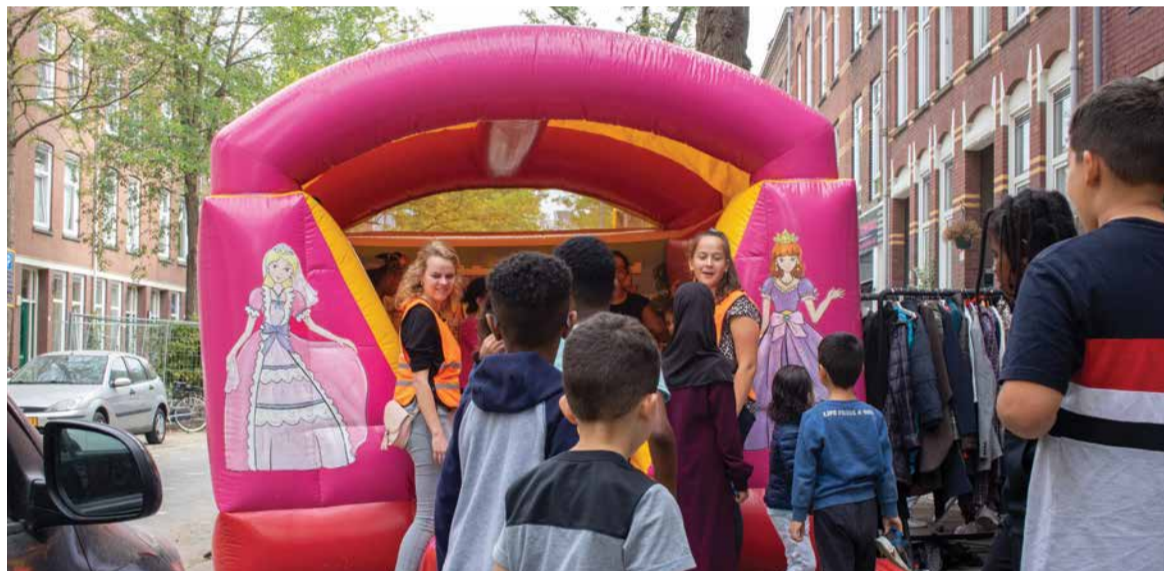
Lekker op straat spelen spelen bij Thuis in West