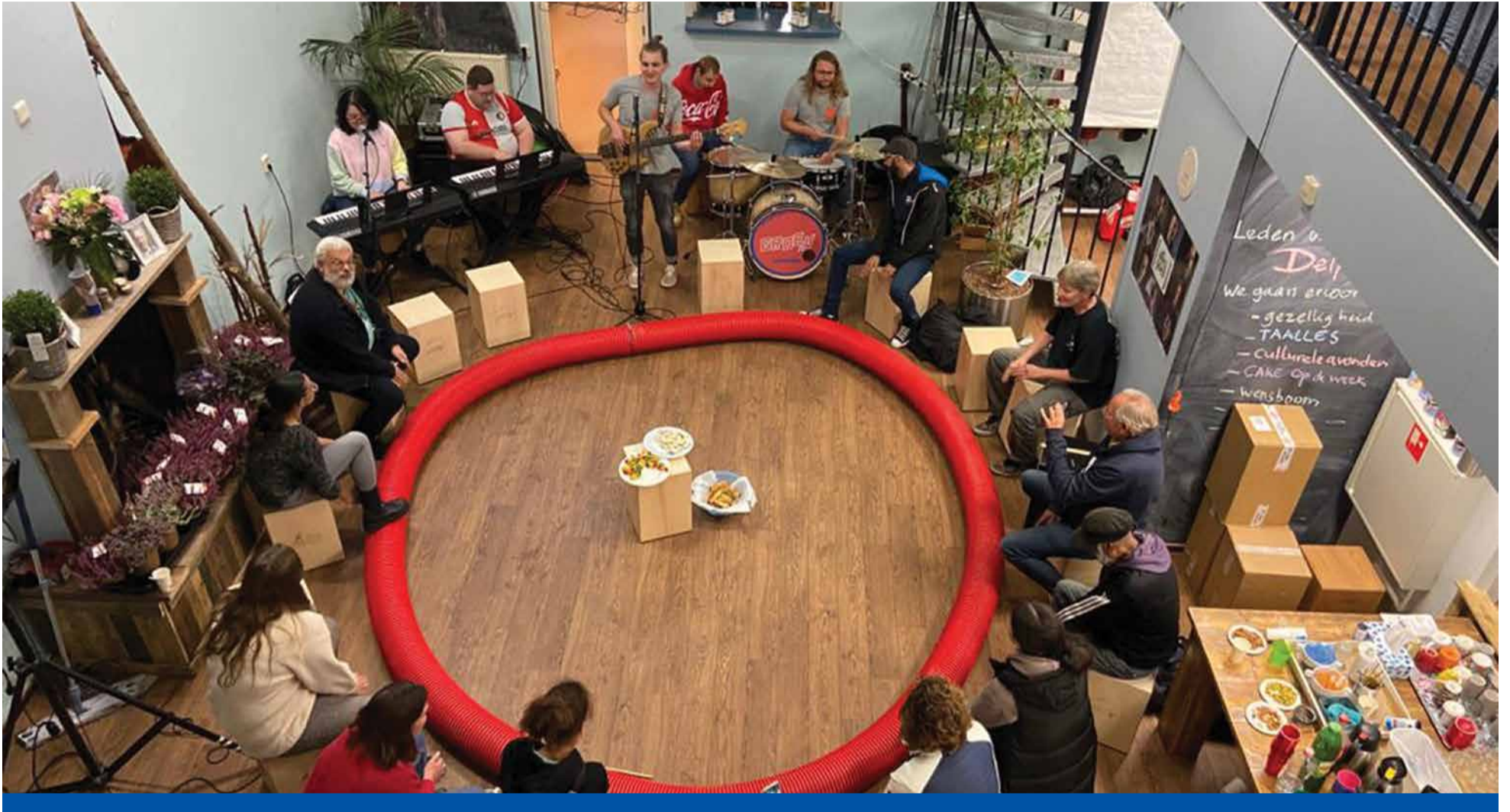
De muziekworkshop Beatbouwers tijdens Gezond Verstand met een optreden van de Groeve Boogie band in het Buurtsteunpunt Spanjaardstraat.

De Week van de Omloop was nog niet voorbij, of het volgende festival diende zich aan. In de week van 26 september tot en met 3 oktober vond voor het tweede jaar op rij Wijkfestival Gezond Verstand plaats. Een week waarin verschillende wijkinitiatieven de krachten bundelen om kennis en ervaringen te delen en te laten zien wat je zelf kunt doen om mentaal gezond te blijven.