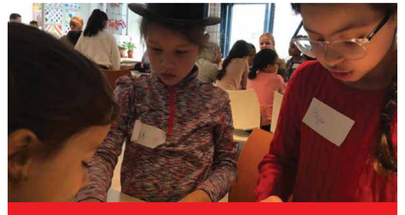
Lekker spelen bij Thuis in West

Aan het einde van de middag zijn er pannenkoeken!