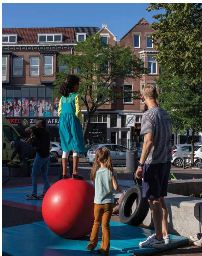
Kunstjes doen met Circus Rotjeknor