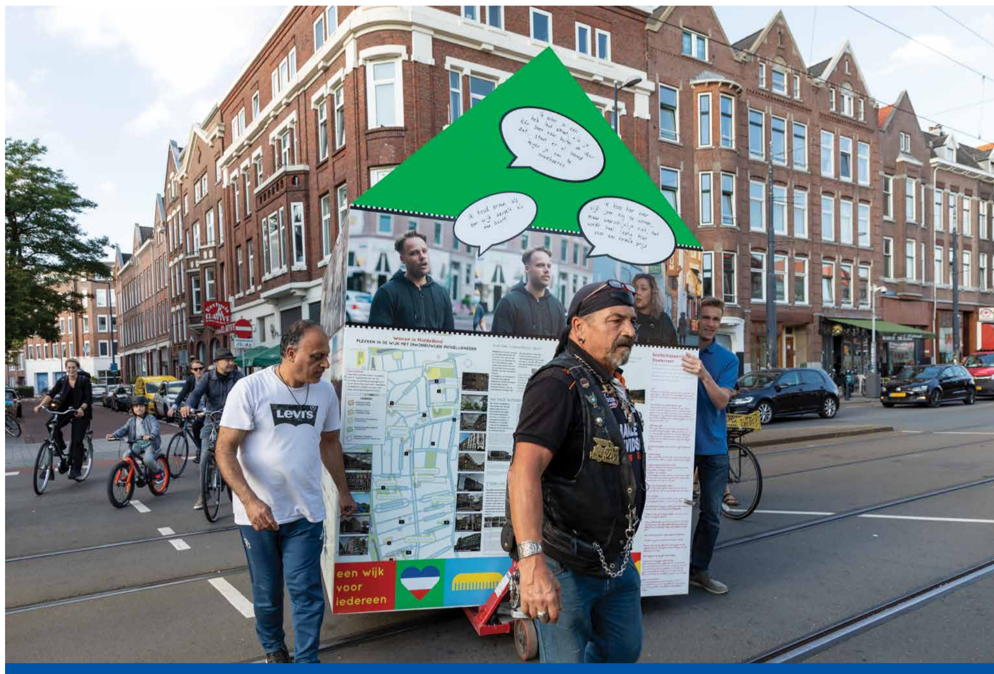
Het huisje is gebouwd op het Dierenlandje en wordt in een parade naar het Middellandplein gebracht.